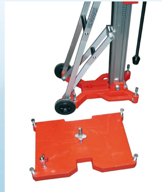
Vakuumsodplade til B 32 og S-3000 borestativ